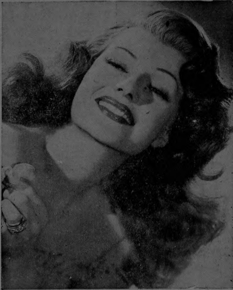
Un cutis tan adorable como el de RITA HAYWORTH, estrella que fuera de la Columbia Pictures, puede conservarse casi indefinidamente con el empleo regular de sólo dos clases de crema, hace ver el experto de Hollywood, Max Factor Jr.

No suponga, sin embargo, que la crema para la piel puede emplearse en lugar de la base invisible de maquillaje como les su-