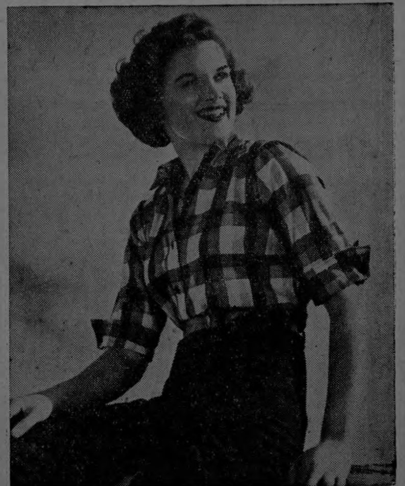
JEAN HAGEN... ACTRIZ DE LA METRO-GOLDWYN-MAYER

Jean Hagen no recuerda momento alguno de su vida en que no haya sentido interés por la carrera artística, y toda su educación se orientó hacia ese sendero. En el colegio, sus más importantes estudios versaron sobre el arte dramático y la calistenia.